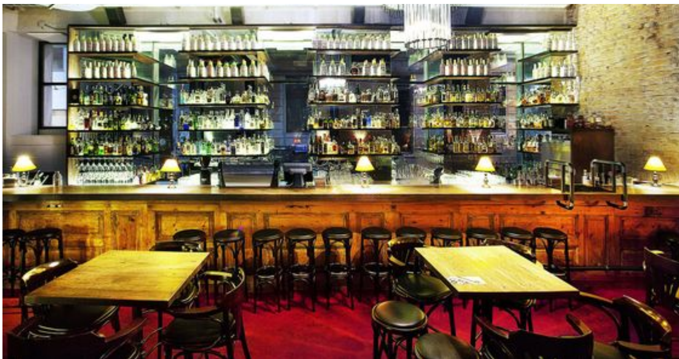
Bar, který neexistuje nic neskývá. Práci barmanů z jedné strany pozorují hosté a ze druhé kolemjdoucí na brněnské Kozí ulici.

"Všichni nám říkali, že trvá půl roku, než do nového podniku začnou chodit hosté. To jsme si ale finančně nemohli dovolit, a tak jsme rozjeli marketingovou kampaň s názvem Bar, který neexistuje a na sociálních sítích jsme popisovali a ukazovali všechno, co se během příprav dělo. Díky tomu jsme si získali ohlasy ještě před otevřením," popisuje Vlachynský.